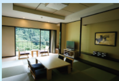
和室 10畳 (全室禁煙) 5名様定員

※3名様・4名様・5名様を1室で利用の場合は料金が変わります。係員にお問い合わせ下さい。