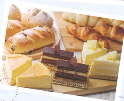
箱根小涌園 スイーツ&ベーカリー