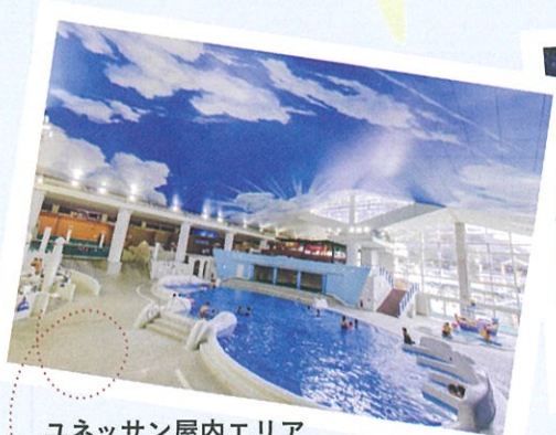
ユネッサン屋内エリア

ユネッサンは箱根の小涌園にある温泉テーマパーク施設です。水着で遊ぶゾーンと、お風呂を楽しむゾーンがあり、家族や友人同士カップルでも、社員旅行など、色々な楽しみ方があります。安全・清潔・快適を追求して行くことは当然のこと、ご来場いただくお客様が楽しんで頂けるエンターテインメント性を高めたお風呂やサービスを展開して参ります。「特別前売り入場券」を福利厚生などにご活用いただきたく、この機会にぜひご用命賜りますようお願い申し上げます。