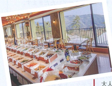
箱根小涌園 大文字テラス