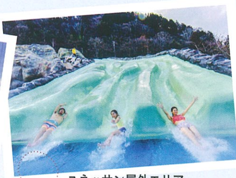
ユネッサン屋外エリア

地中海の空を描いたドーム内にあり、雨でも猛暑でも楽しめる全天候型の屋内温泉エリア。「神々のエーゲ海」を中心とし、「ドクターフィッシュの足湯」「ワイン風呂」「本格コーヒー風呂」といったアミューズメント感覚溢れる温泉が盛りだくさんです。